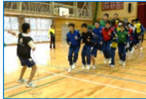
主運動 （作戦タイム等を設け、 生徒が考える機会を作る）