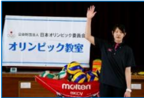
自己紹介 今日の学習内容の確認