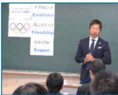
座学での学習内容の 確認