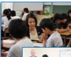
グループ（個人）ワーク 発表も行う