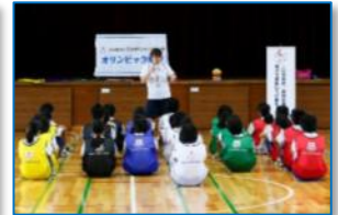
運動の授業のまとめ