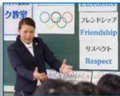
オリンピック自身の経験 に基づく「オリンピックの 価値」等について話す