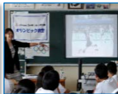
写真・映像等を使用 した自己紹介