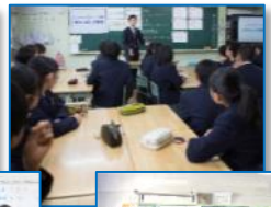
全体のまとめ/記念撮影