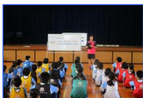
自己紹介 今日の学習内容の確認