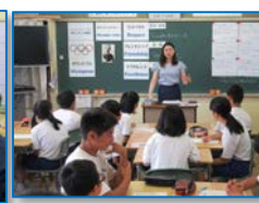
全体のまとめ/記念撮影