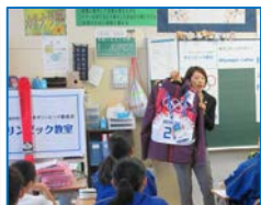
写真・映像等を使用 した自己紹介