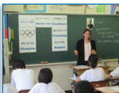
オリンピック自身の経験に 基づく「オリンピックの価値」等 を伝える