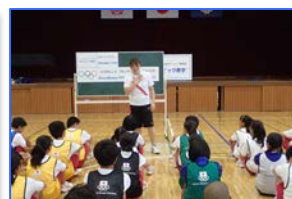
運動の授業のまとめ