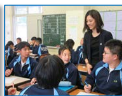
グループ（個人）ワークで 話し合った内容を発表