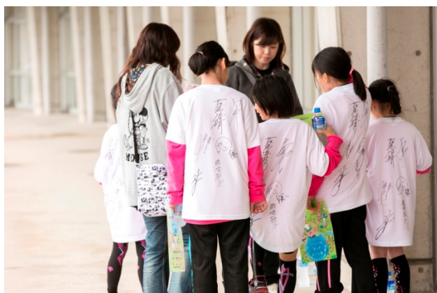
・当日受付先着順に配布されたオリンピックサイン会参加券を手にオリンピック全員からサインをもらう参加者。