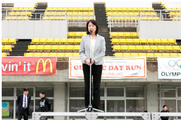
・主催者を代表して大曲昭恵福岡県副知事から挨拶。