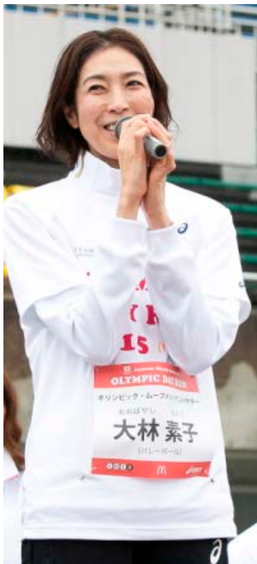
大林 素子 氏 (バレーボール)