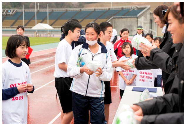
・オリンピックからプレゼントを受け取る最後まで勝ち残った10名の参加者。