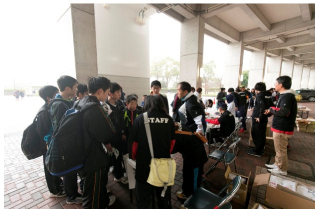
・午前8時00分受付開始。