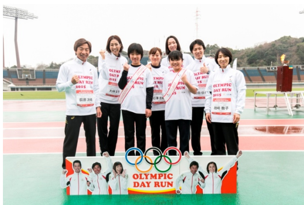
・オリンピアンが質問箱から引き当てた質問者と共に。