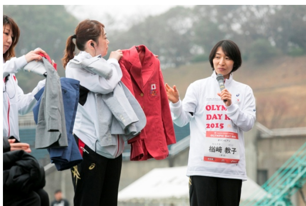
・日本代表選手団の公式服装を紹介する榎崎氏。