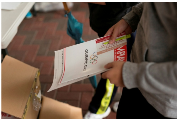
・受付後、当日の配布物を受け取る。