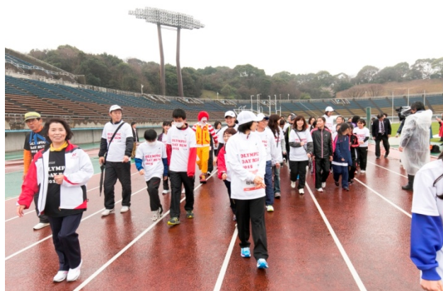
・オリンピックと一緒に和やかな雰囲気の中、ウォーキングスタート。