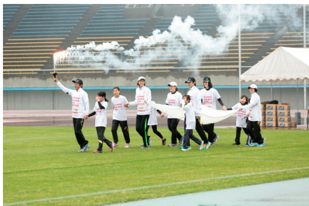
・エスコートキッズがオリンピック・ムーブメントアンバサダー、オリンピックと手をつなぎ入場。