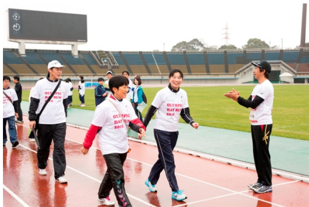
・ゴールではオリンピックとドナルドがハイタッチや大きな声援と共に参加者を迎える。