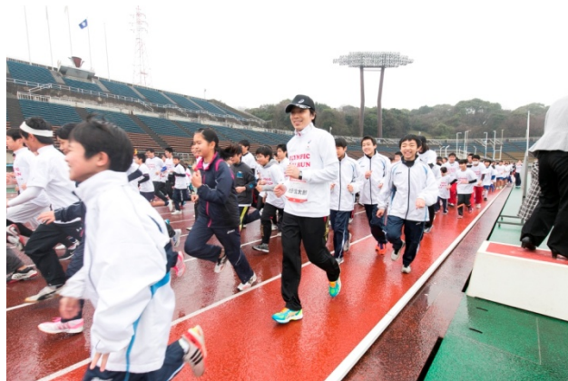
・オリンピックと一緒にジョギングスタート。