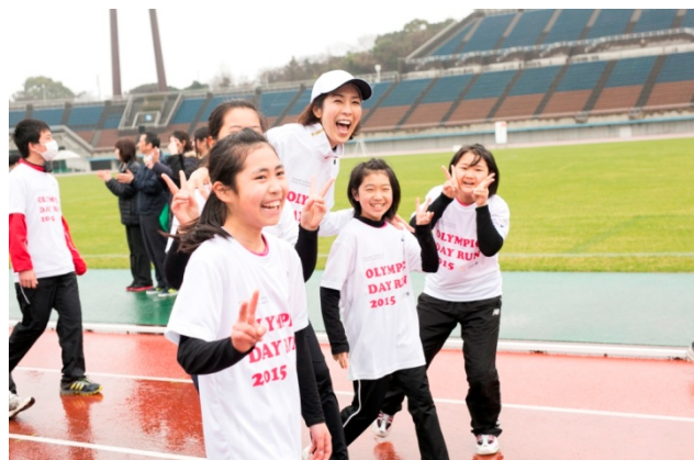
・オリンピックと共に元気な姿で参加する子供たち。