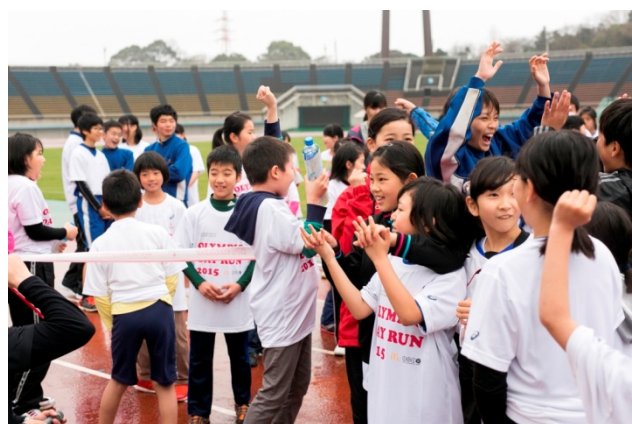
・一問ごとに大きな歓声がわく。