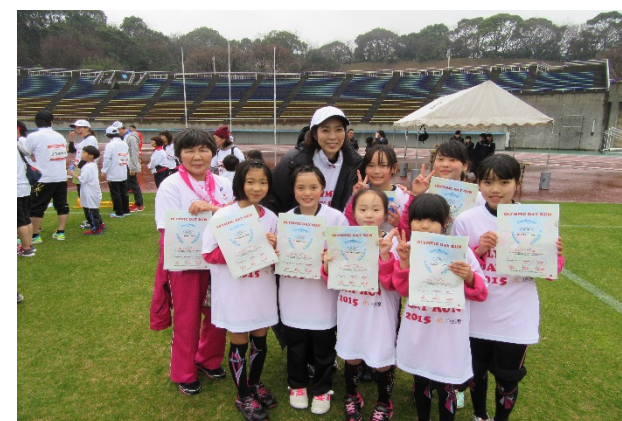
・ゴール後、オリンピックからオリビズム賞（オリンピックバリュー／価値を紹介するクリアファイル）を贈呈。