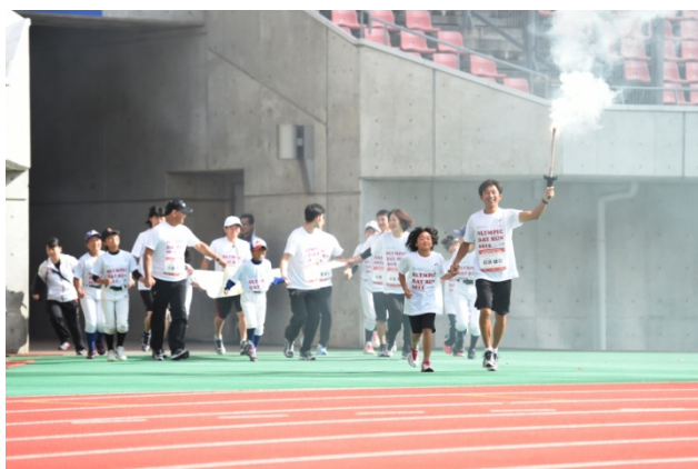
・エスコートキッズがオリンピック・ムーブメントアンバサダー、オリンピックと手をつなぎ入場。