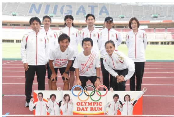
・オリンピアントークショーでオリンピアンが質問箱から引き当てた質問者と共に。