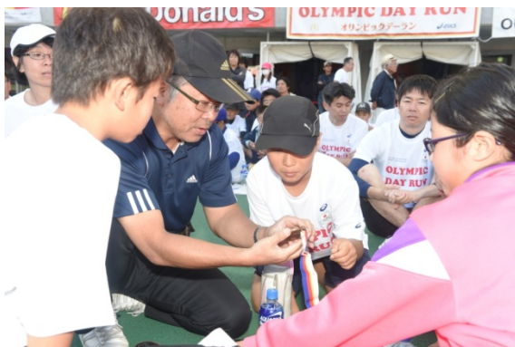
・メダルを手に感動する参加者。