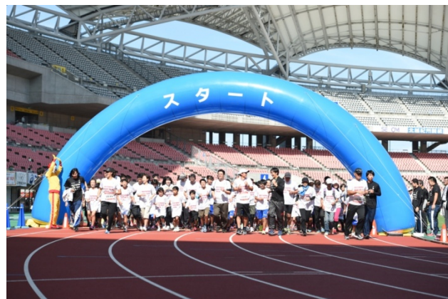
・オリンピックと一緒にジョギングスタート。