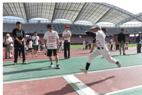
・オリンピックと一緒にスポーツ体験（陸上競技／走幅跳・走高跳、テコンドー）を楽しむ参加者。