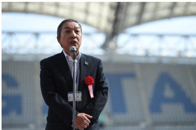
・主催者を代表して木村勇一新潟市副市長から挨拶。