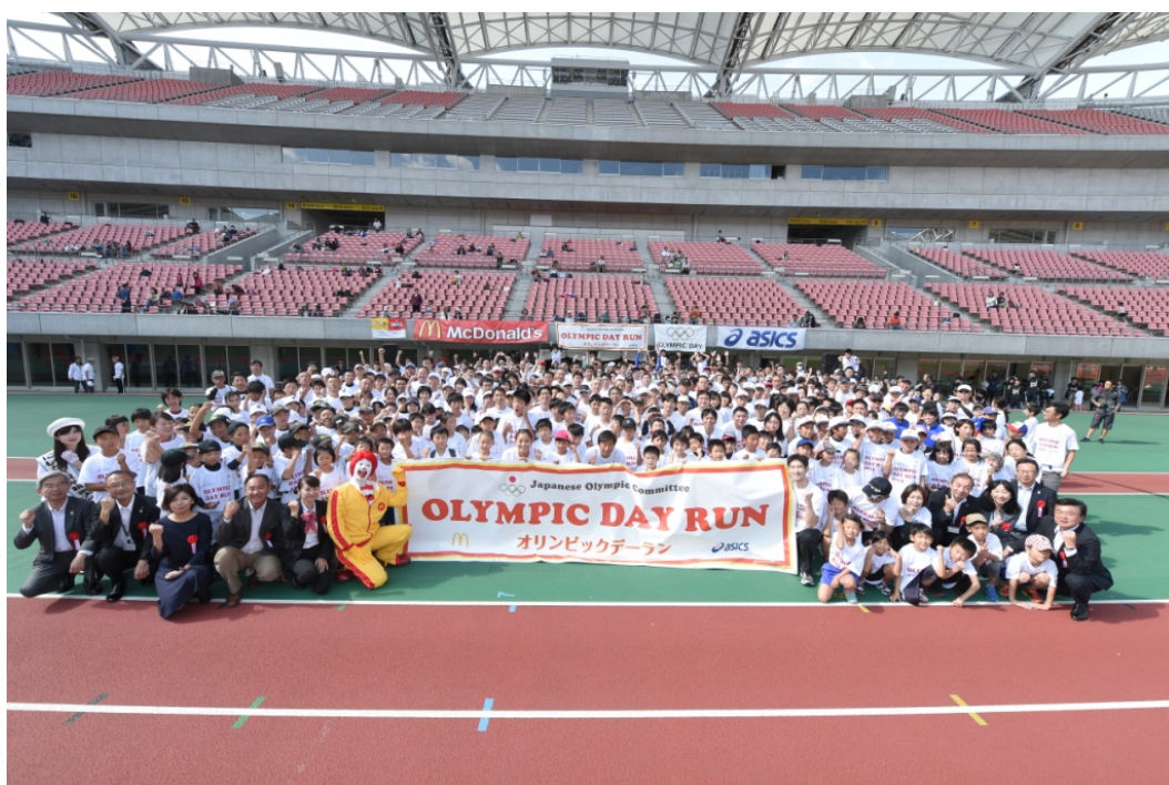
・参加者全員で記念撮影。