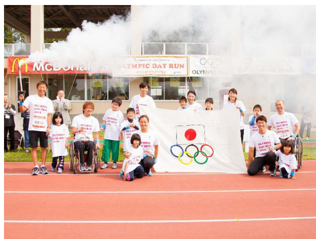
・全員で記念撮影。