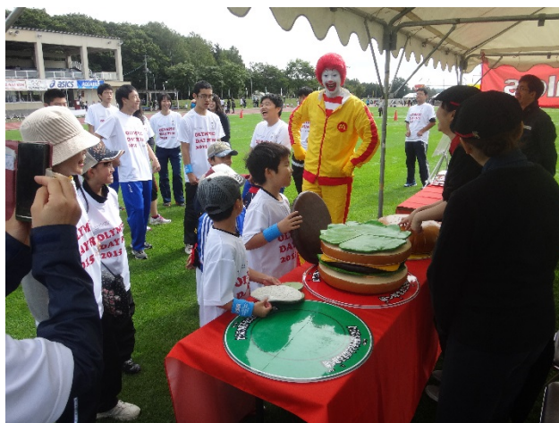
・ドナルドと一緒にビッグマックに使われている食材を正しい順番で重ねて、ビッグマックを完成させる。 ・食材が体に果たす役割を知ってもらう食育プログラム。