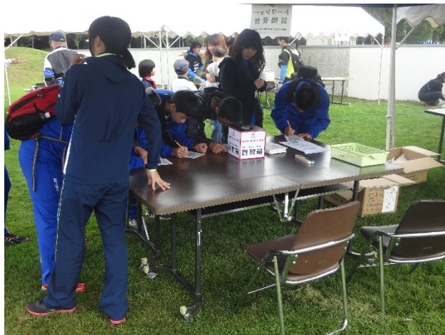
・オリンピアントークショー用の質問を参加者から募集。