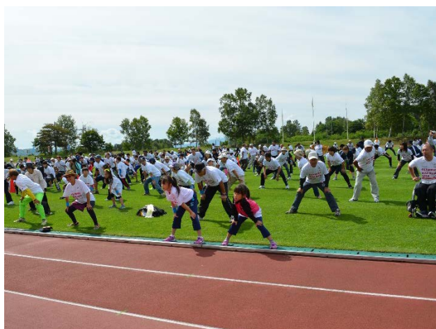
・参加者全員でドナルドと一緒にオリジナル体操を実施。