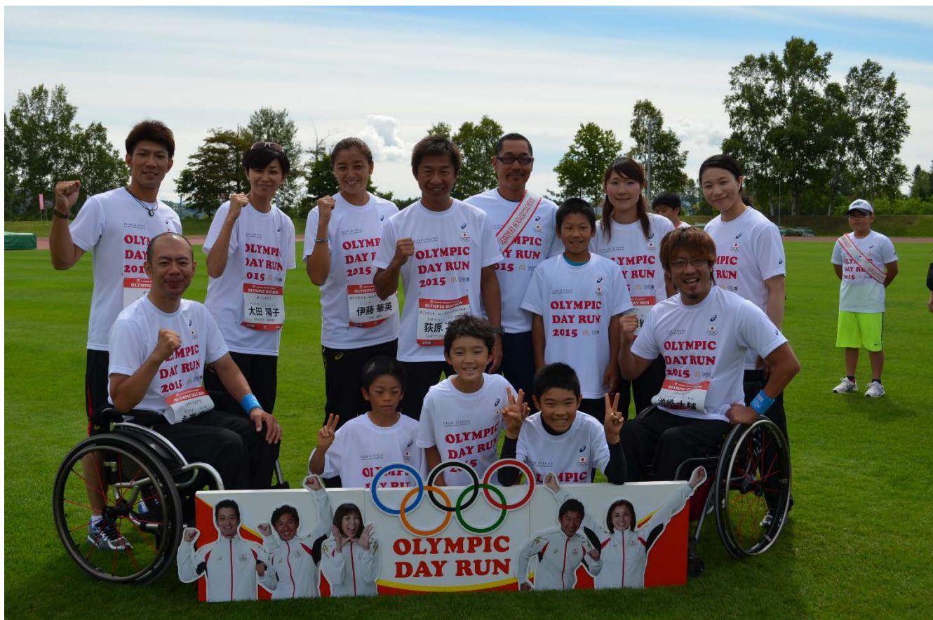
・オリンピックトークショーの際、オリンピックが質問箱から引き当てた質問を記載した参加者と共にオリンピック全員が記念撮影。