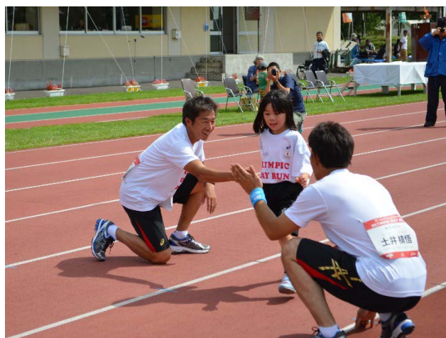
・ゴールではオリンピックがハイタッチで参加者を迎える。