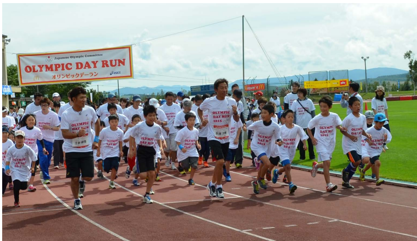
・オリンピックと一緒にジョギング・ウォーキングスタート。