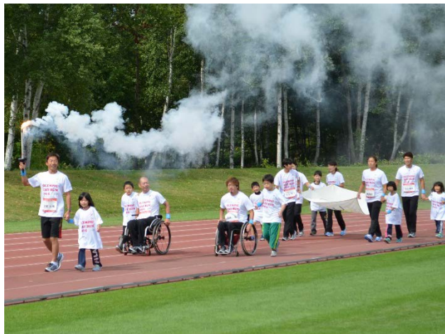
・エスコートキッズがオリンピック・ムーブメントアンバサダー、オリンピック、パラリンピアンと手をつなぎ入場。