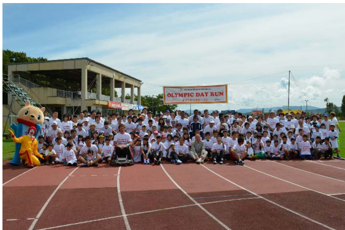
・参加者全員で記念撮影。会場には2017冬季アジア札幌大会のマスコットキャラクター「エゾモン」がかけつけた。