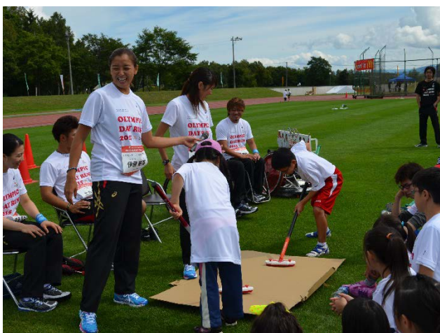
・カーリングのスイーピングを体験する参加者。