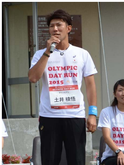
土井 慎悟 氏 (スケート・スピードスケート)