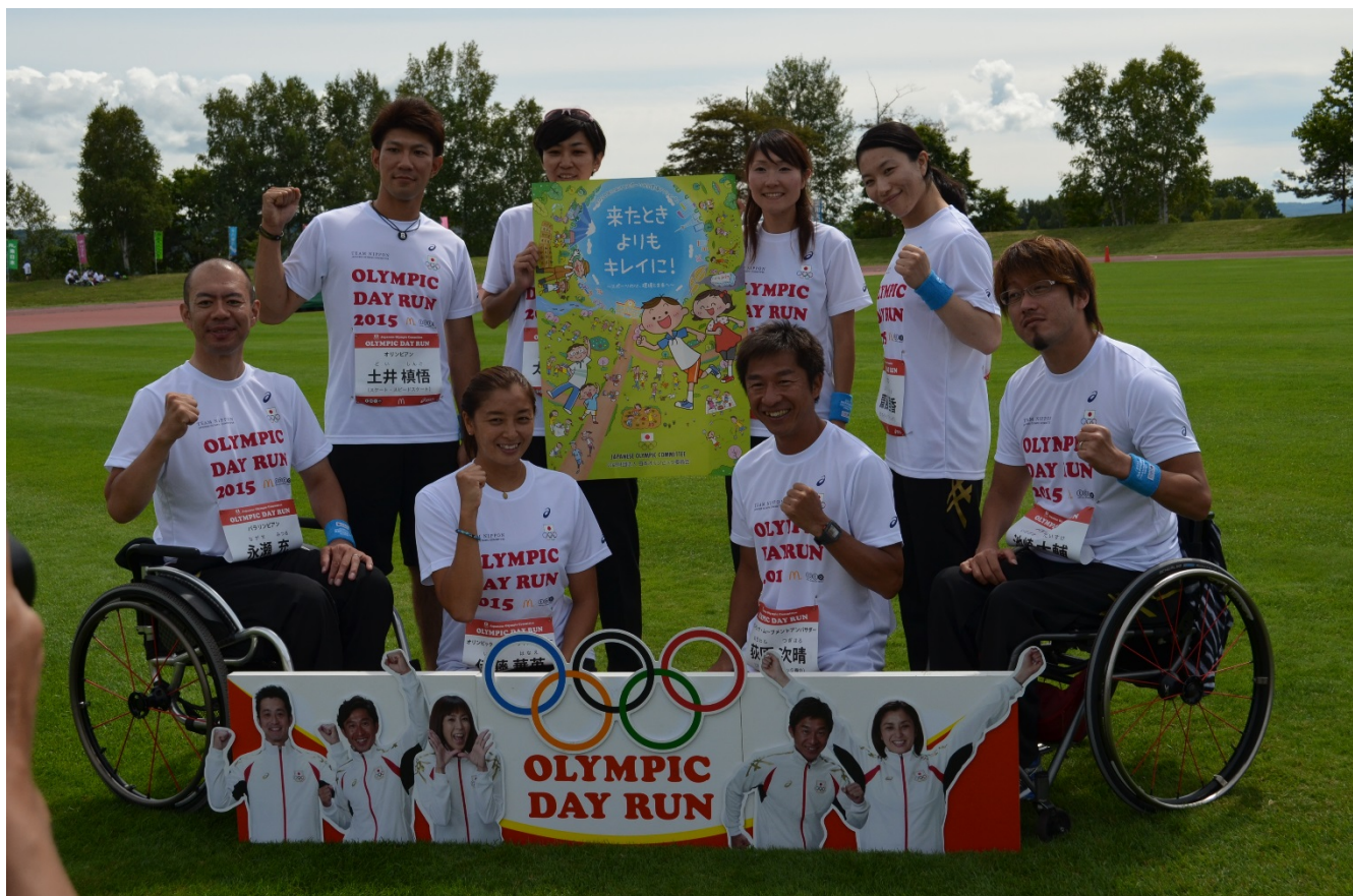
・会場では、スポーツを通じた環境保護の重要性も周知。