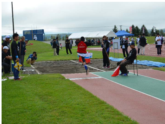
・陸上競技の走幅跳を体験。