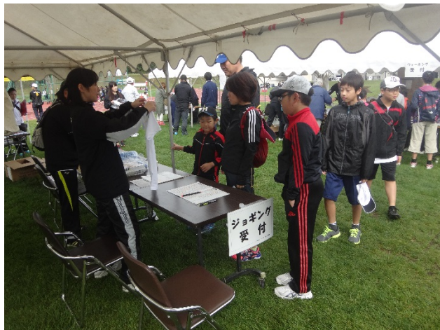
・午前8時00分受付開始。