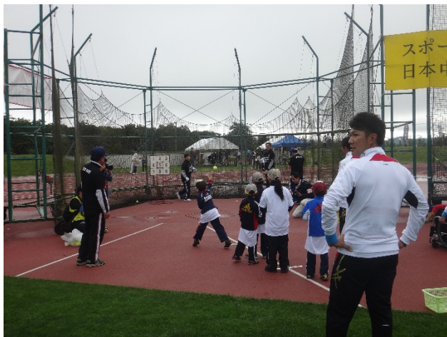
・オリンピックが見守る中、的に向かってボールを投げる参加者。