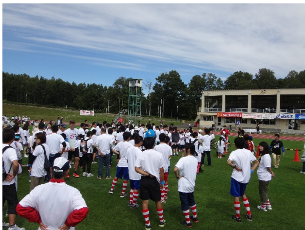
・オリンピックからオリンピックや競技にまつわるクイズを出題。