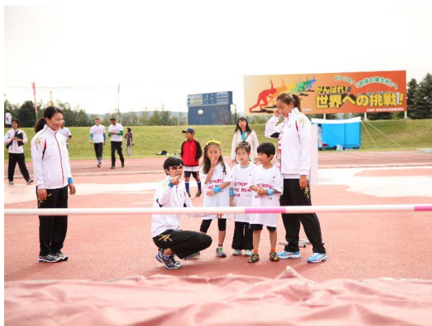
・陸上競技の走高跳を体験。