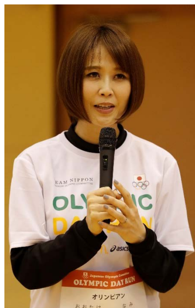
大竹 七未 氏 (サッカー)