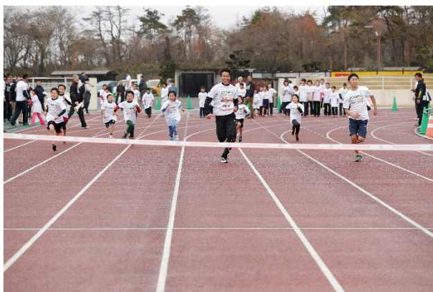
・参加した小学生が細田氏と50m走で真剣勝負。