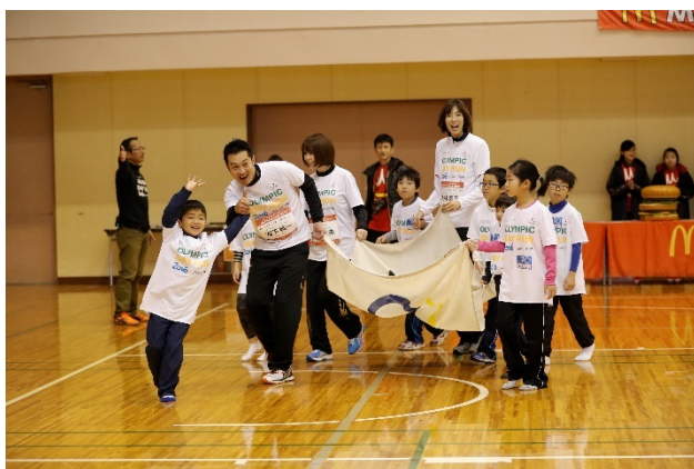
・エスコートキッズがオリンピック・ムーブメントアンバサダー、オリンピアンと手をつなぎ入場。