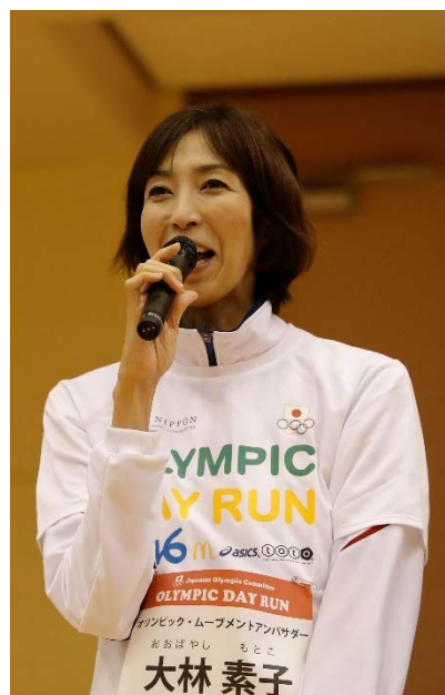
大林 素子 氏 (バレーボール)