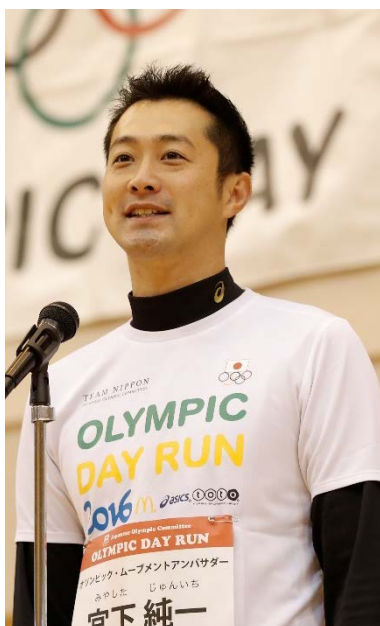
宮下 純一 氏 (水泳・競泳)