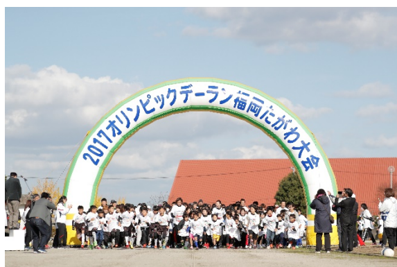
・オリンピックと一緒にジョギングスタート。