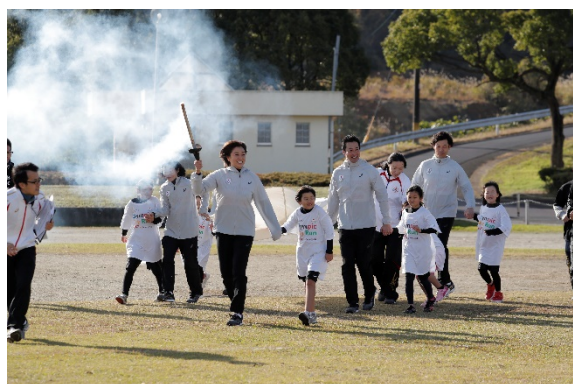
・エスコートキッズがオリンピック・ムーブメントアンバサダー、オリンピックと手をつないで入場。