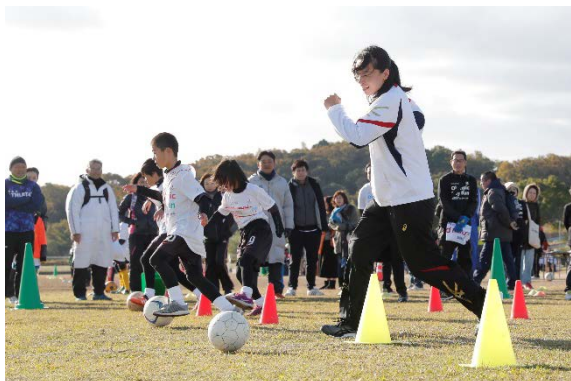
・オリンピックとともにジグザグドリブルにチャレンジする参加者