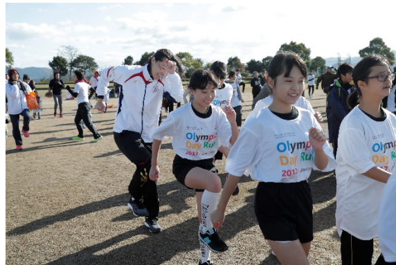
・参加者全員で準備体操を実施。