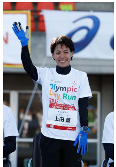
上田 藍 氏 (トライアスロン)