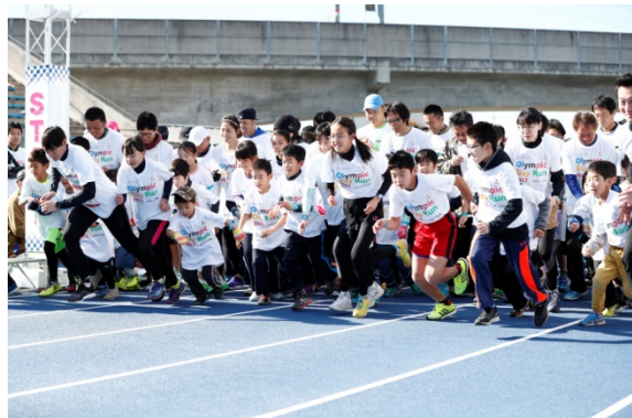
・オリンピックと一緒にジョギングスタート。