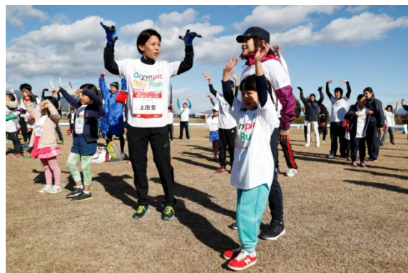
・参加者全員で準備体操を実施。