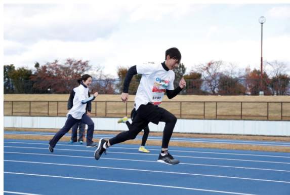
・高平氏の圧倒的なスピードに歓声があがる。