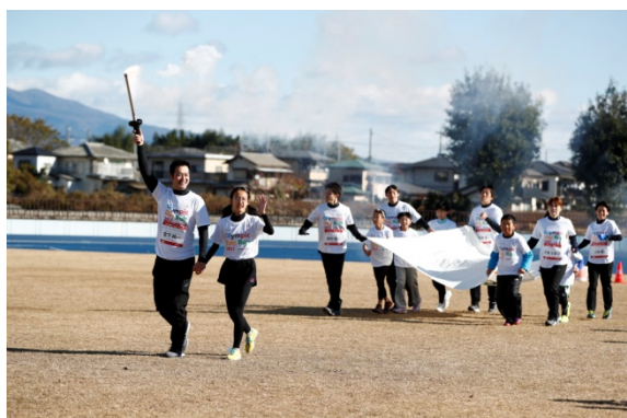
・エスコートキッズがオリンピック・ムーブメントアンバサダー、オリンピックと手をつないで入場。