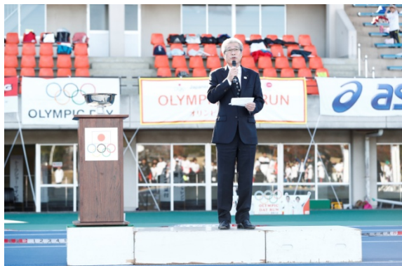
・主催者を代表して、兵藤公保 高崎市副市長から挨拶。