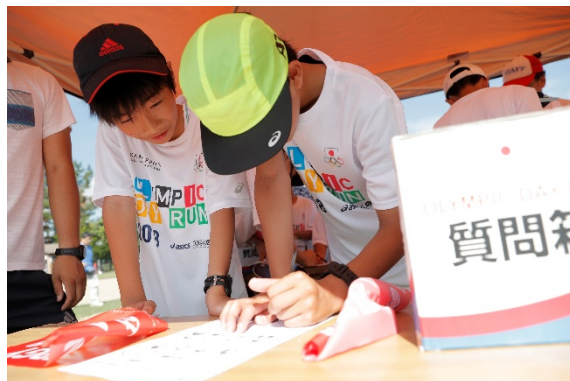
・オリンピックへの質問記入コーナーを設置。