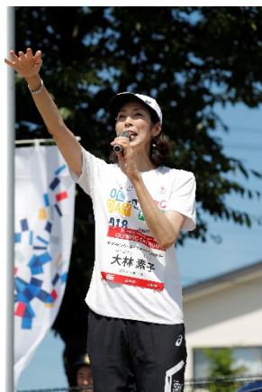
大林 素子 氏 (バレーボール)