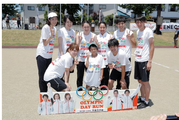
・当選者と記念撮影するオリンピック。