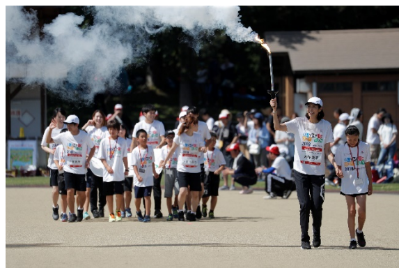
・オリンピック・ムーブメントアンバサダー、オリンピックとエスコートキッズが手をつないで入場。