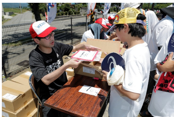
・スタンプラリー達成者にハンドタオルをプレゼント。