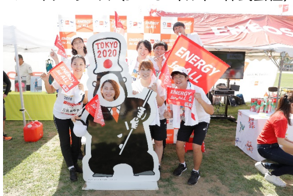
・JOCゴールドパートナーのJXTGエネルギー株式会社によるブース。