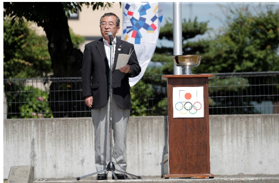
・主催者を代表して、遠藤 忠一 喜多方市長から挨拶。