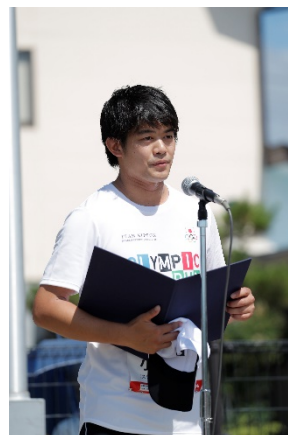
小塚 崇彦 氏 (スケート/フィギュアスケート)