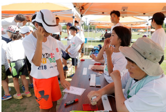
・5か所をめぐるスタンプラリーを実施。