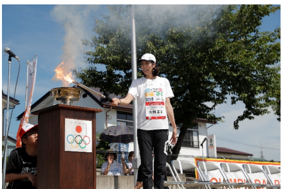
・大林氏がトーチ台へ点火。