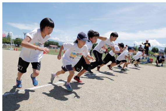
・両角氏も50m競走に挑戦