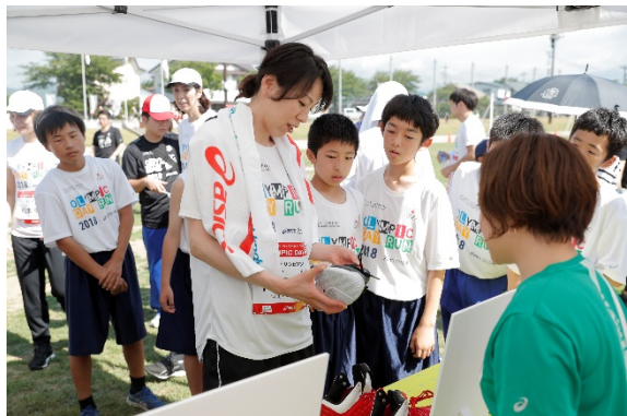
・JOCゴールドパートナーのアシックスジャパン株式会社によるブース。