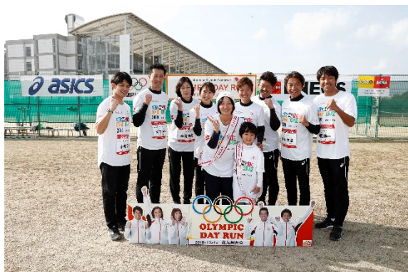
・当選者と記念撮影するオリンピック。