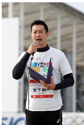
宮下 純一 氏 (水泳/競泳)