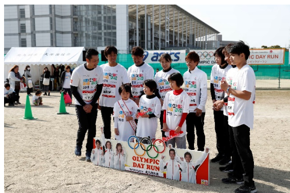
・C賞当選者のインタビュー。