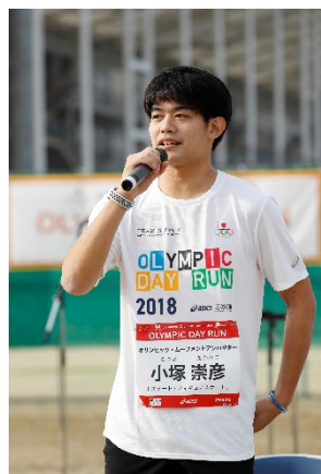
小塚 崇彦 氏 (スケート/フィギュアスケート)