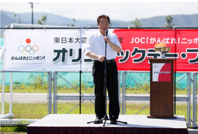
相馬市長 立谷秀清