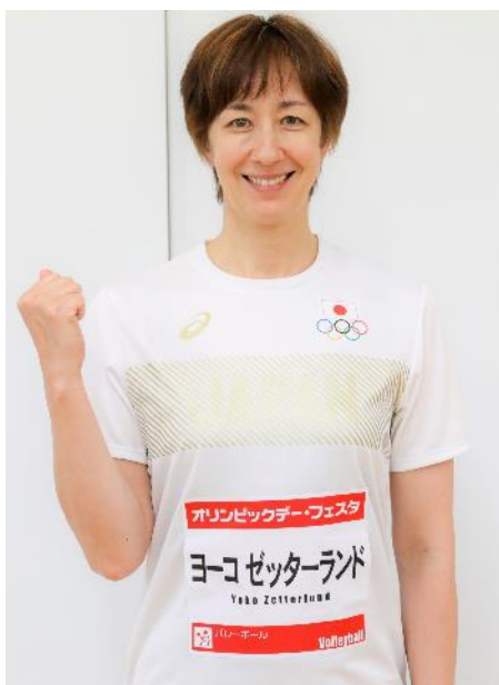
ヨーコ・ゼッターランド (バレーボール)