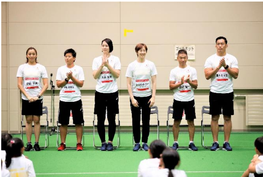
◇チームジャパン代表挨拶