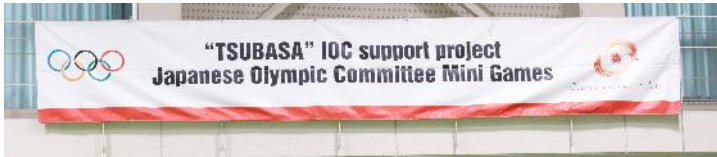
JOCメッセージバナー