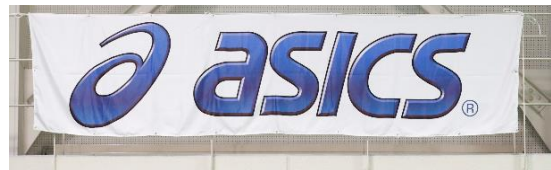
アシックスジャパン