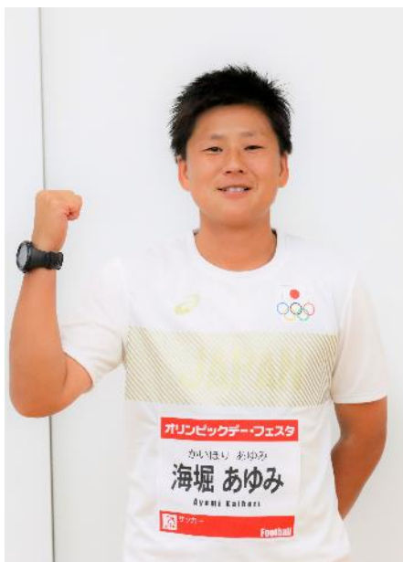
海堀 あゆみ (サッカー)