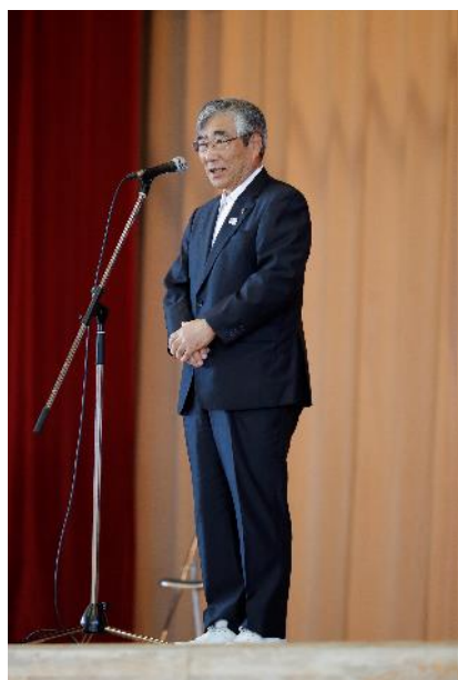
亀山 紘 石巻市市長