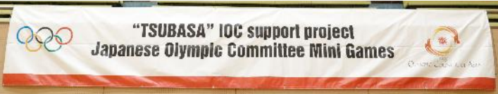
JOCメッセージバナー