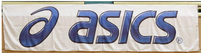
アシックスジャパン