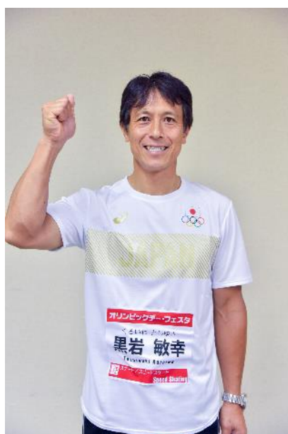
黒岩 敏幸 (スピードスケート)