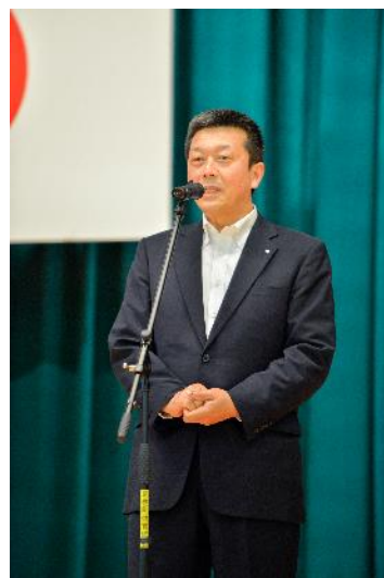
葛巻町町長 鈴木重雄