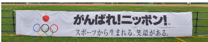
JOCメッセージバナー