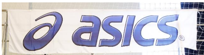
アシックスジャパン