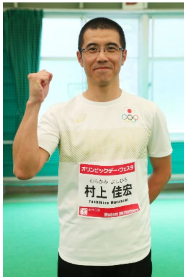
村上佳宏 (近代五種)