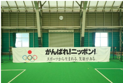
JOCメッセージバナー