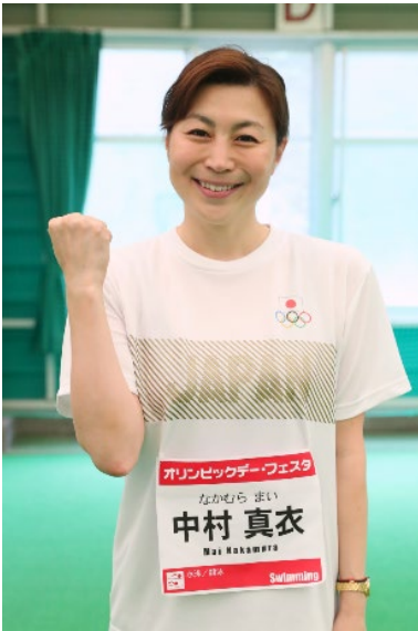
中村真衣 (水泳/競泳)