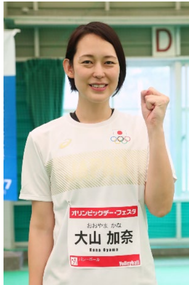
大山加奈 (バレーボール)