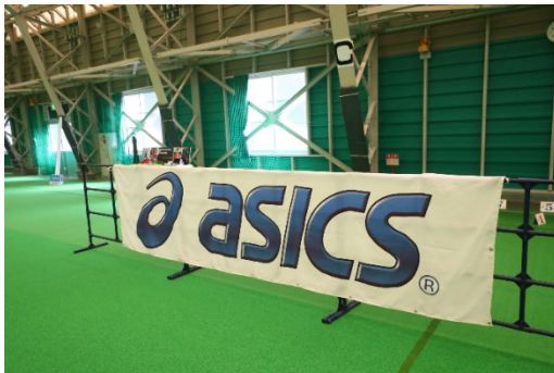
アシックスジャパン