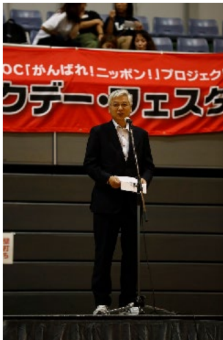
気仙沼市 副市長 赤川郁夫