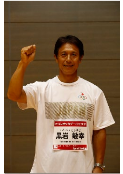
黒岩敏幸 (スケート/スピードスケート)