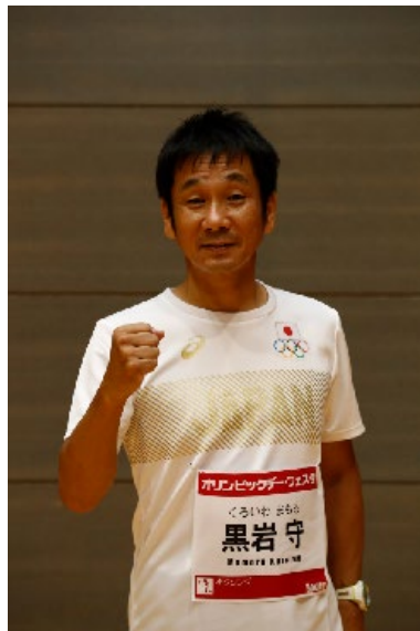
黒岩守 (ボクシング)