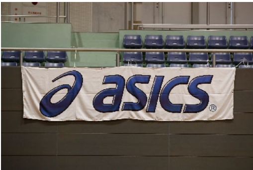
アシックスジャパン