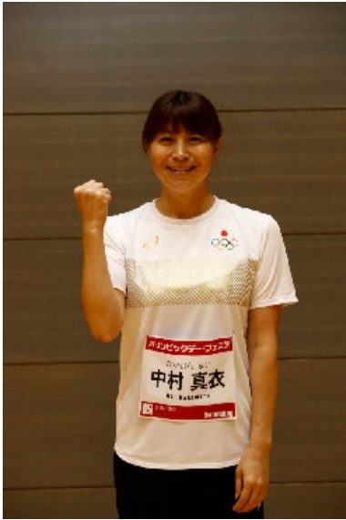
中村真衣 (水泳/競泳)