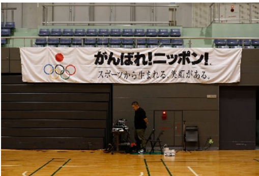
JOCメッセージバナー