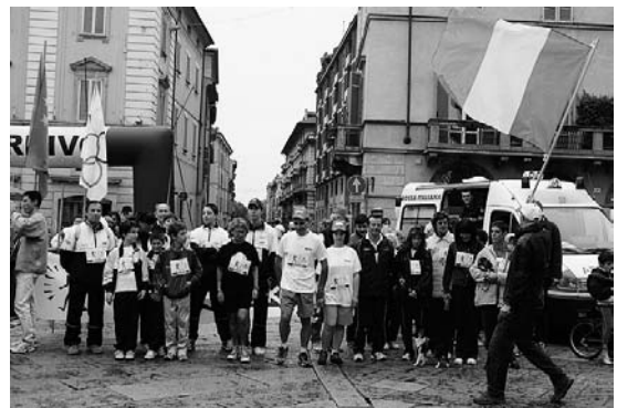
健康ウォーキング大会

日本では、馴染みがないが、イタリア国内の主要マラソン大会や競歩大会においては、競技スポーツ以外にも、自治体主催で健康ウォーキング大会やペットなどと一緒に歩くドッグウォークなどが行われている。このような取り組みの中心を担っているのが、イタリア競歩協会である。このような草の根的な活動から歩くことに触れ、競歩に興味を持ってもらうことも競技スポーツを支える底辺には