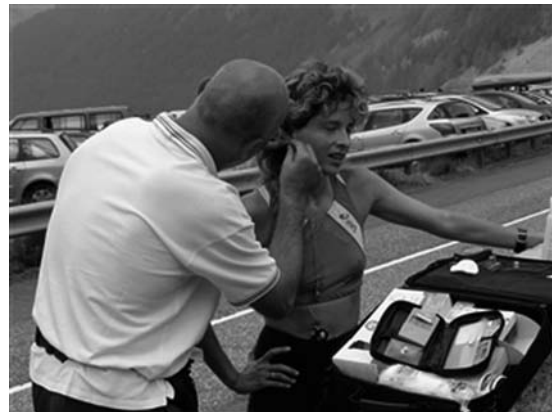
スポーツ医科学との連携

近代スポーツ発祥の多くは、イギリスと言われているが、競歩においても同様で、イギリスを中心に発展してきた。オリンピックでは、1908年ロンドン大会で行われた3500m競歩や10マイル競歩以降、今日では男子20km競歩、50km競歩、女子20km競歩へと種目に変更され、オリンピック公式種目として開催されている。近代競歩は、イタリア、スペイン、ロシアなどを中心としたヨーロッパ諸国がリーダーとなり、競技ルールの変遷、記録、トレーニング方法などが発展してきたと言っても過言ではないだろう。