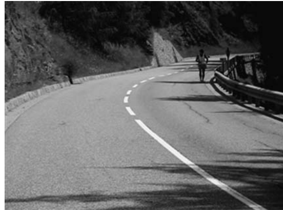
坂道トレーニングコース