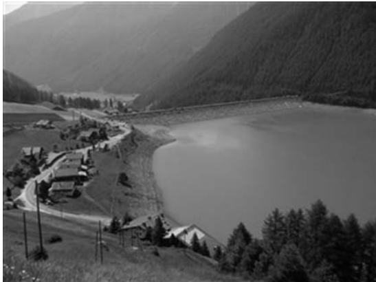
トレーニングコース