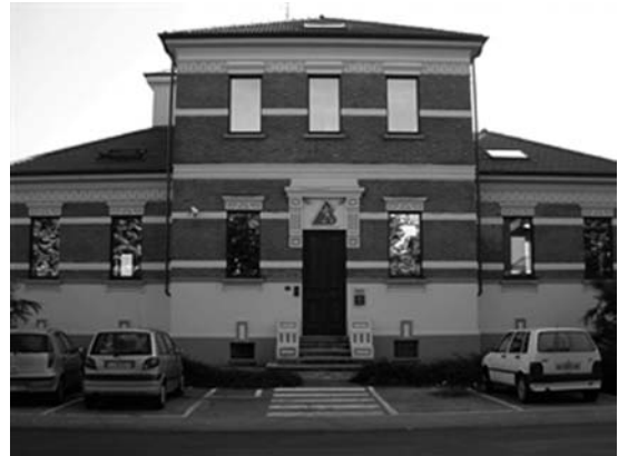
Centro Federale di Marcia

ここ競歩センターには、宿泊施設(ツインルームが7部屋)および大小の会議室、トレッドミルなどを備えた機能的なトレーニングルームなども併設されており、ジュニア、アンダー23、シニアなどの強化合宿や陸連強化委員の会議、そしてコーチ研修、さらには、国際会議や