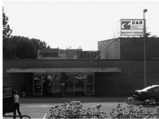
Centre d'Alt Rendiment（オリンピックセンター）

ここ、Centre d'Alt Rendiment（オリンピックトレーニングセンター）は、1987年にスペイン国内の有望競技者が強化拠点を構え、競技に専念できるようにカタロニア州政府の協力を得て設立された国内初のスポーツ強化拠点である。バルセロナ市内から20kmの郊外にあり、施設は全ての競技に対応できる設備が整