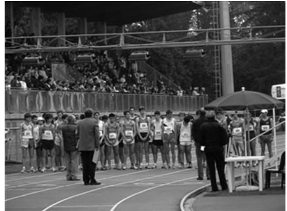
ピエモンテ州選手権

よって北部地方にはメダル獲得の伝統があり、現場コーチのオリンピック経験が豊富であると言えるだろう。陸連主導の下、コーチライセンスの取得義務、そして、コーチ間における方法論の共通理解がなされ、トレーニングの原理原則を尊重するなど、具体的な国際競技力の向上方策を掲げ、組織的に取り組んだ成果と感じている。