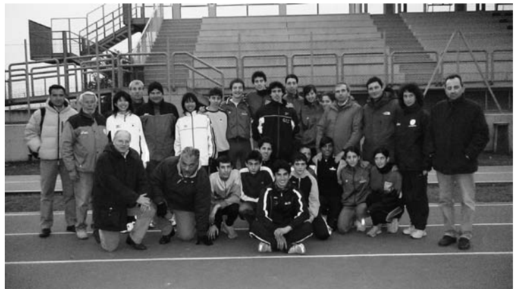
未来への架け橋～ジュニア合宿～

イタリア陸連のジュニア強化策のひとつとして、「プロジェクト・タレント」がある。日本的に言えば、「タレント発掘プロジェクト」となる。これは、2008年北京、2012年ロンドンを見据えた一貫指導と金銭サポートを意味している。クラブチーム所属である16～20歳以下のジュニア競技者を対象とし、トレーニングやそれに関わる資金サポートを行っている。総勢80名、各種目2～4名ほどが選抜され、年間2～4回の合同合宿を各ブロックで行い、また、家族支援として3000ユーロ（日本円で約50万円）の資金をバックアップしている。