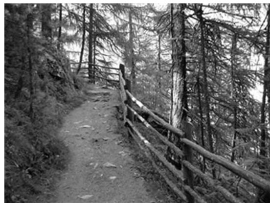
クロスカントリーコース

この測定方法を考案したルキアノ・ジリオッティ氏は、イタリア陸連の医科学委員でもありスポーツ生理学者としても知られ、オリンピックのマラソンではボルディン選手（1988 ソウル）、バルディニ選手（2004 アテネ）、競歩では、